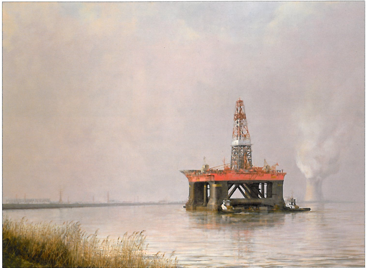
Flanders Technology - "Yatzy" • Olië/Huile