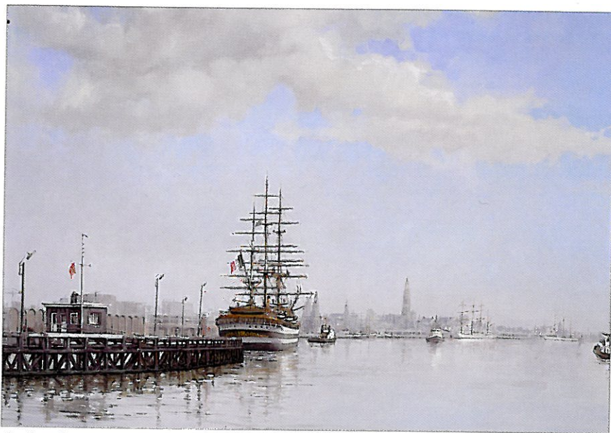
Op de rede van Antwerpen • Olië/Huile (fragment) • Rade d'Anvers